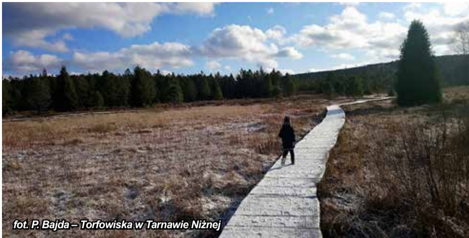
Torfowiska w Tarnawie Niżnej

Bieszczadzki Park Narodowy podaje, że ok. o 3 proc. zmniejszyła się liczba turystów, którzy weszli na szlaki na terenie parku. Największą popularnością nadal cieszy się szlak do Chatki Puchatka oraz Tarnica.