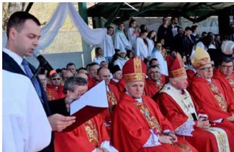
Spotkanie Młodych Archidiecezji Przemyskiej, kwiecień 2017 roku w Ustrzykach Dolnych.

Jak pisze Rzeczpospolita, takie pomysły mieli już wcześniej inni samorządowcy i dyrektorzy szkół, głównie ze względu na problemy lokalowe spowodowane reformą oświaty. Mniej godzin religii mają np. poznańscy maturzyści. Dziennik zwraca uwagę na to, że kurie zazwyczaj jednak odmawiają samorządowcom (m.in. w Krakowie, Gdańsku czy w Warszawie). Zgody na zmniejszenie liczby godzin religii udzielały tylko poszczególnym szkołom i tylko ze względu na problemy lokalowe. W Warszawie, w tym roku szkolnym, 83 szkoły otrzymały zgodę na zmniejszenie wymiaru godzin lekcji religii. W Gdańsku ośmiu dyrektorów złożyło w kurii wnioski o zmniejszenie liczby godzin religii i wszyscy uzyskali zgodę na zmniejszenie, łącznie o 106 godzin.