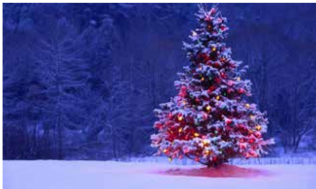
Jak choinka, to tylko z lasu.

Ależ ten czas leci. Chwilę temu zbieraliśmy prawdziwki i rozkoszowaliśmy się cudowną, ciepłą jesienią, a tu już za chwilę trzeba orzechy do placków obierać, wędzarnię rozgrzewać, choinkę ubierać. Święta tuż, tuż.