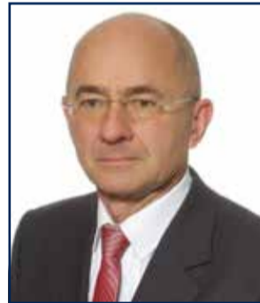
Antoni Kostka Fundacja Dziedzictwo Przyrodnicze

niż całe pozyskane drewno, to i tak wytniemy trochę, bo jeszcze ktoś zauważy, że może las niepielęgnowany piłą ma się całkiem dobrze.