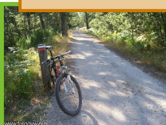
Zielona ścieżka « la Demanda » w Regionie Burgos, ES